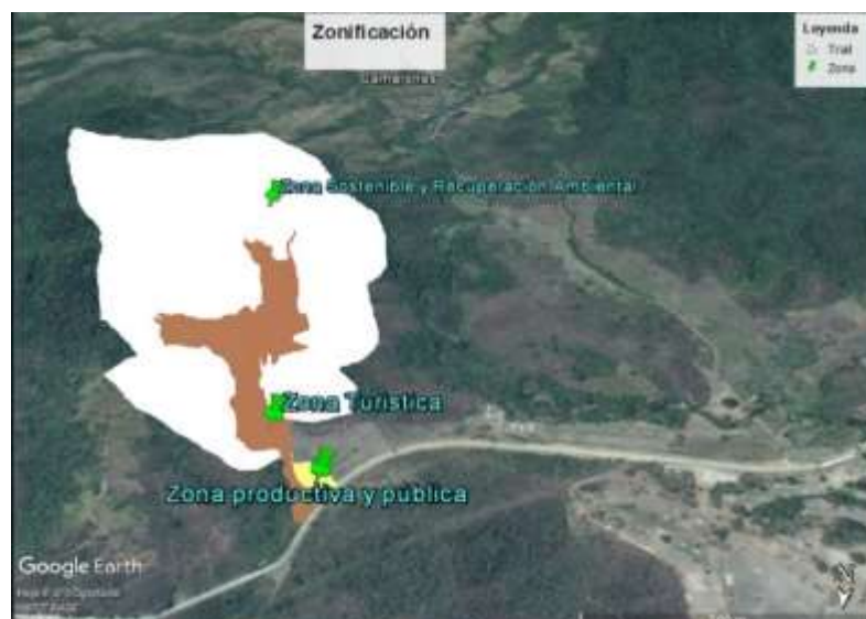
Figura 4. 2. Mapa de zonificación