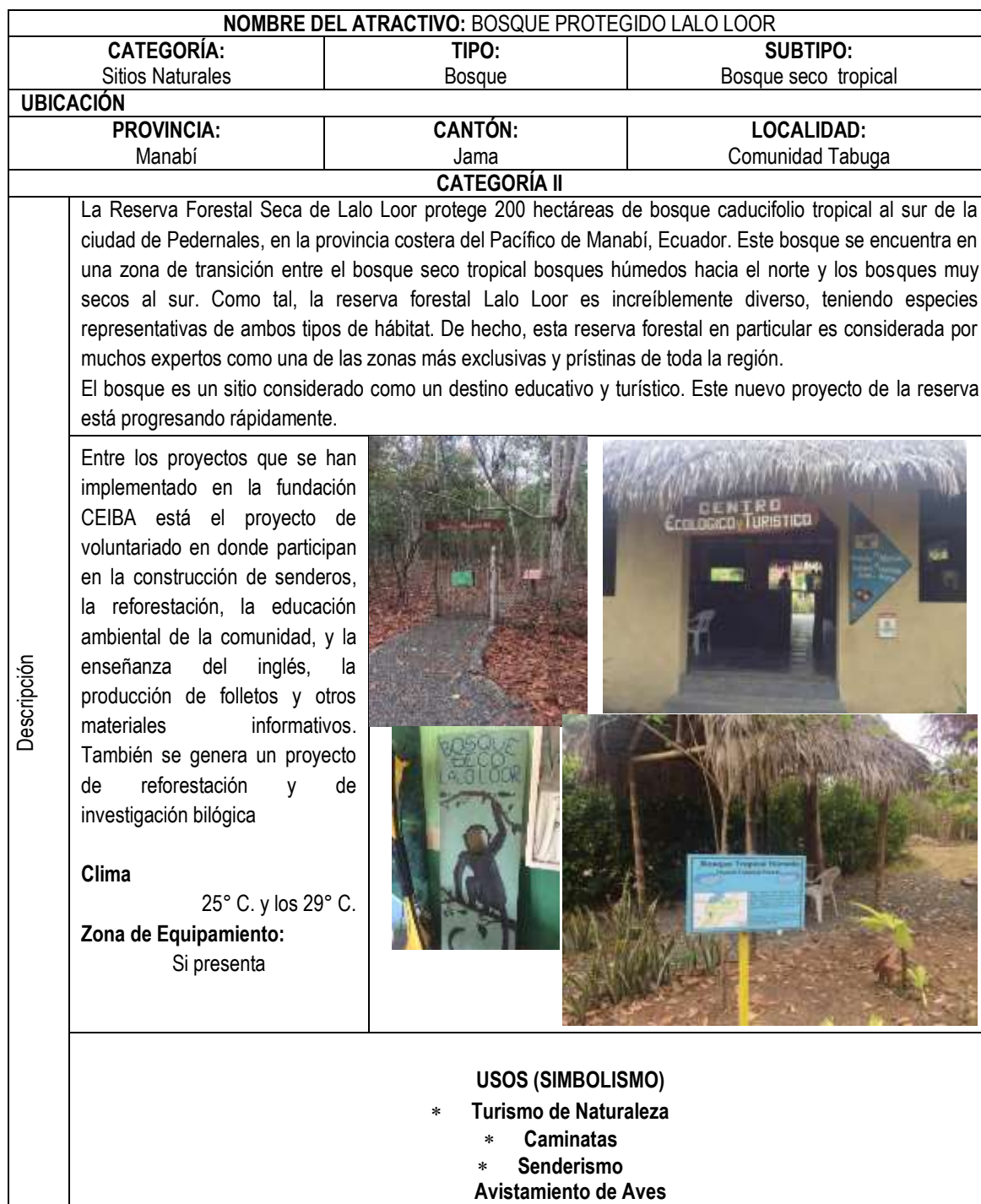
Cuadro 4. 2. Ficha de Inventario del Bosque Lalo Loor