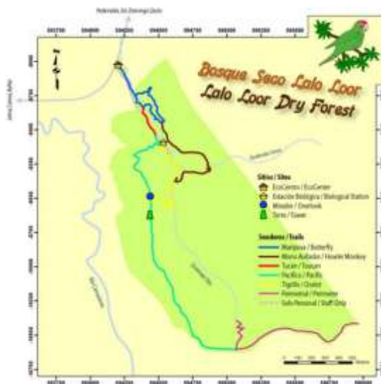
Figura 4. 3. Mapa de senderos