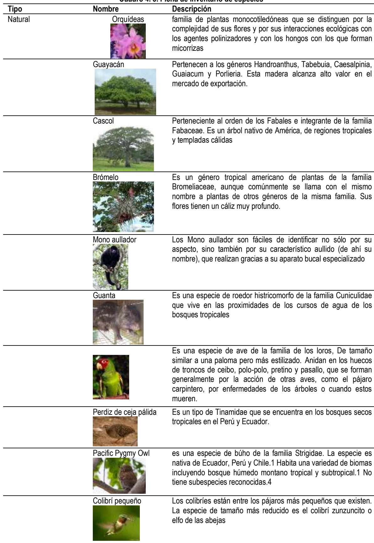
Cuadro 4. 3. Ficha de inventario de especies