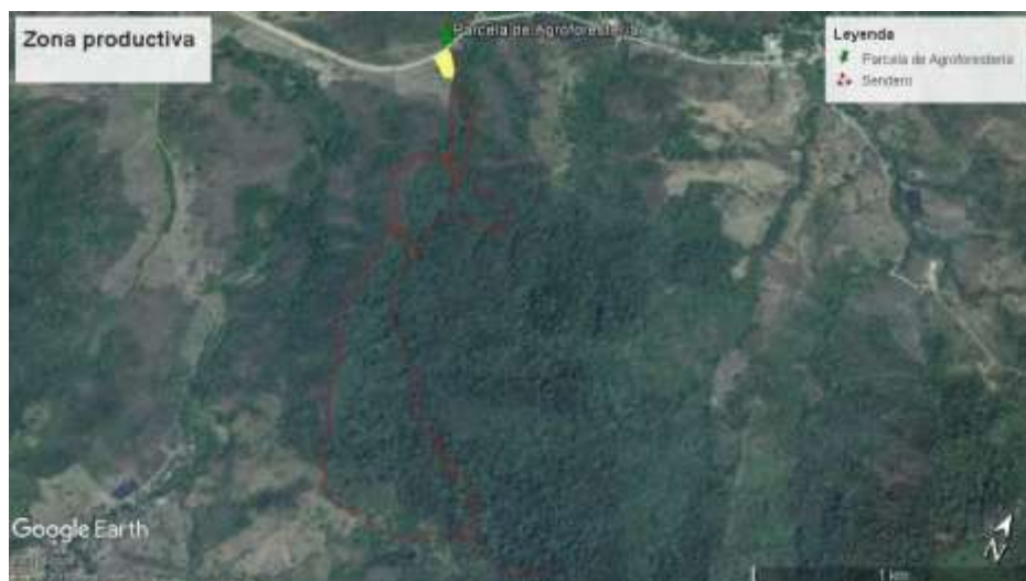
Figura 4. 4. Mapa de Zona Productiva

Esta zona es la que se encuentra con fines de productividad agrícola y de uso público, en donde los involucrados desarrollan actividades económicas como la plantación de cultivos para consumo humano con el fin de lograr una mayor productividad, mejor rendimiento económico, y más beneficios sociales en un plazo sostenible. (Figura 4.4.)