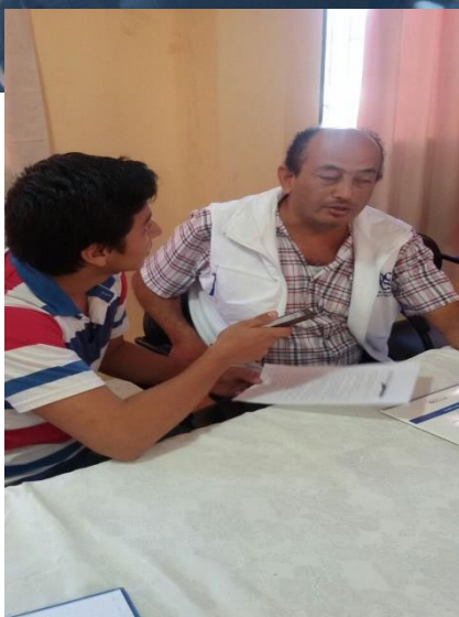
entrevista al Sr. Ramón alcalde el cantón Bolívar