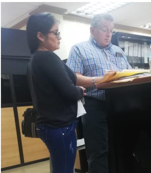
Foto 4.6 Encuesta realizada a Ex Director de la Economía Popular y Solidaria Zonal 4