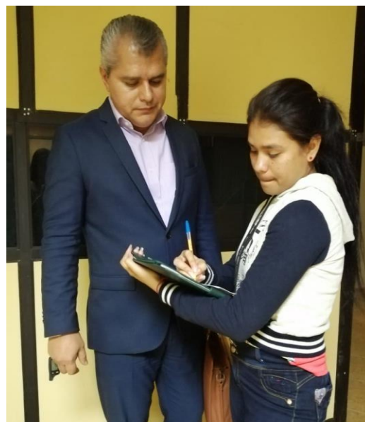
Foto 4.8 Encuesta realizada a Jefe Zonal de Planificación del SRI