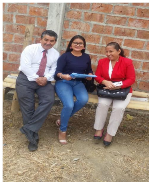
Foto 4. 4 Encuesta realizada a la Ex concejala del cantón Junín en el período 2014-2019