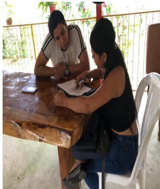
Foto 4.3. Encuesta realizada al Ex Presidente de la Junta Parroquial de Menbrillo- Bolívar, período 2014-2019