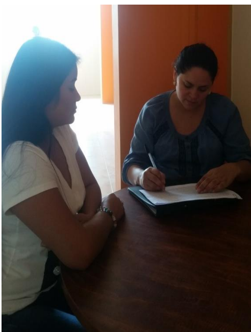
Foto 4. 2 Encuesta realizada a Analista-Auditor del sector no Financiero de la Superintendencia de Economía Popular y Solidaria de la Intendencia Zonal 4