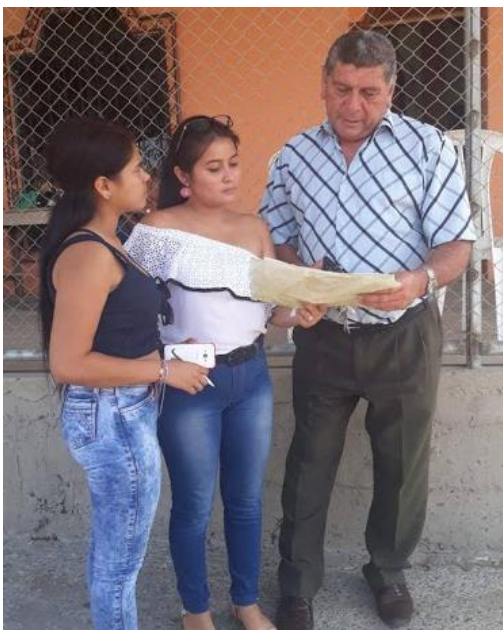
Foto 4.5 Encuesta realizada a Ex Concejal de Junín del Período 2010-2014