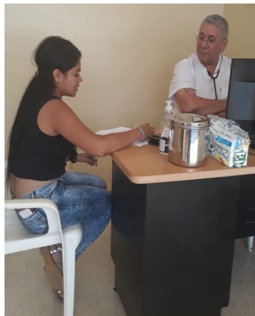
Foto 4.7 Encuesta realizada al Ex Vicealcalde del período 2010-2014 Cantón Junín