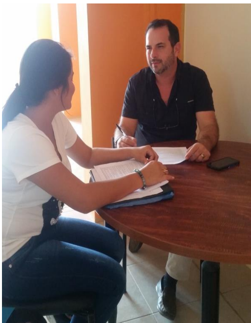
Foto 4.1 Encuesta realizada a Ex Director del Sector no Financiero de la Superintendencia de Economía Popular y Solidaria de la Intendencia Zonal 4.