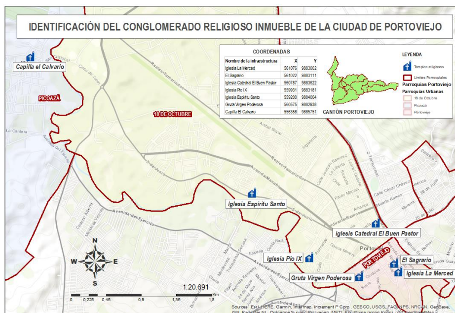
Figura 4. Identificación del conglomerado religioso inmueble de la ciudad de Portoviejo