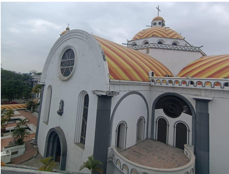
Anexo 5. Catedral Jesús, el Buen Pastor

24. ¿Cómo cree usted que pueden ser aprovechadas las manifestaciones culturales religiosas que se dan a partir de las festividades dentro del marco turístico?