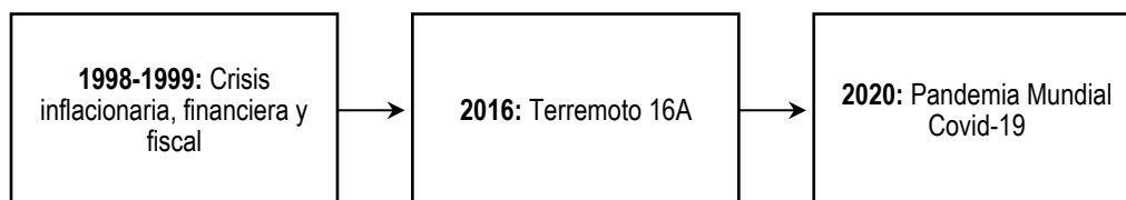
Figura 1. Línea de tiempo sobre los acontecimientos que impactaron el desarrollo territorial del cantón Portoviejo

alterar el desenvolvimiento de un territorio, entre estos uno de los más comunes es el ambiental. A lo largo del tiempo, la capital manabita ha sufrido grandes procesos de cambio que han dificultado el camino hacia alcanzar el tan anhelado desarrollo. A continuación, se presenta una línea de tiempo para precisar aquellos acontecimientos más destacados que influyeron directamente en el avance social e indirectamente a la arquidiócesis portovejense: (ver figura 1)