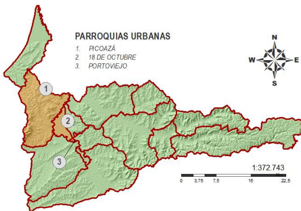
Figura 3. Mapa de identificación de las parroquias